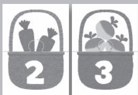
5 cartes puzzles chiffres et quantités