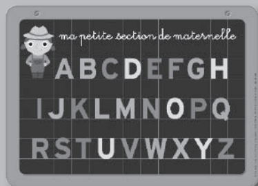
1 tableau de l'alphabet