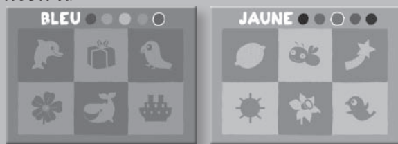
5 planches de loto